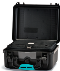
* interior bag