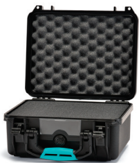
* cubed foam